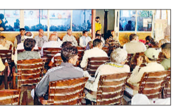
महेंद्रगढ़। कार्यकर्ताओं को दिशा-निर्देश देते विधायक।