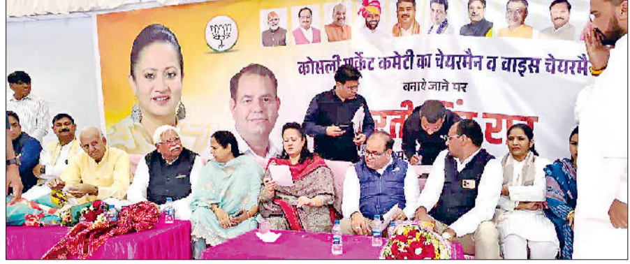
कोसली। किसान भवन में मौजूद स्वास्थ्य मंत्री आरती सिंह राव व अन्य।

■ दवा वितरण के कार्य को सुचारु किया गया हरिभूमि न्यूज ▶▶ कोसली