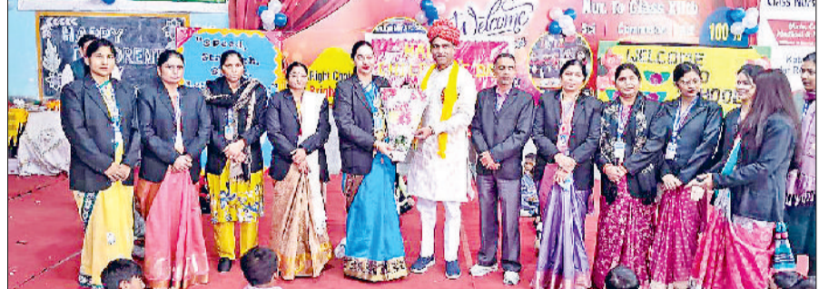
रेवाड़ी। कार्यक्रम वीफ गेस्ट का स्वागत करते हुए स्कूल स्टाफ।

■ बाल दिवस पर बच्चों ने सुंदर प्रस्तुतियां दी हरिभूमि न्यूज ▶▶ रेवाड़ी