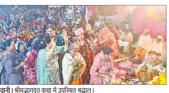
भिवानी। श्रीमद्भागवत कथा में उपस्थित श्रद्धालु।

सुरक्षित रखती है, जिससे न केवल पशुओं का स्वास्थ्य बेहतर रहता है बल्कि दुग्ध उत्पादन में भी स्थिरता बनी रहती है। उन्होंने बताया कि मुंहखुर बीमारी से पशुओं के मुह, जीभ व खुरों पर घाव हो जाते हैं, जिससे दूध उत्पादन पर विपरीत असर पड़ता है, वहीं गलघोट्ट एक घातक बुखारजनित रोग है जो सांस व गले को प्रभावित करता है।