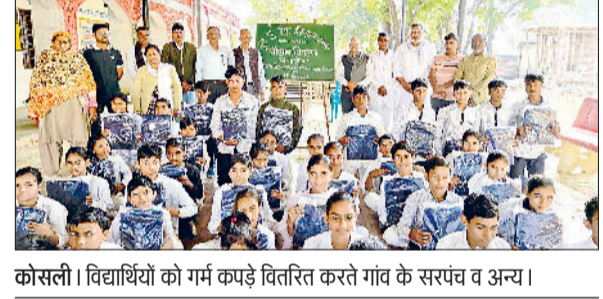
कोसली। विद्यार्थियों को गर्म कपड़े वितरित करते गांव के सरपंच व अन्य।