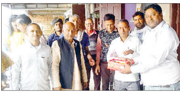
कनीना। मिठाई बांटकर खुशी जताते व्यापारी।