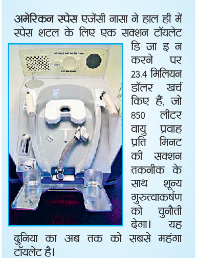
दुनिया का अब तक का सबसे महंगा टॉयलेट है।

पब्लिक टॉयलेट के इस्तेमाल में बरतें सावधानी: व्यापक सर्वे और अध्ययन के बेस पर विशेषज्ञों का मानना है कि अगर आप किसी सार्वजनिक शौचालय में सबसे साफ शौचालय का इस्तेमाल करना चाहते हैं, तो पब्लिक में सबसे पहले वाले शौचालय कक्ष (जो दरवाजा या सिंक के सबसे पास हो) का ही इस्तेमाल करें। यह आमतौर पर सबसे कम यूज किया जाता है और इसलिए तुलनात्मक रूप से अधिक साफ होता है। सबसे गंदा स्थान नहीं है टॉयलेट: आपको यह जानकर हैरानी होगी कि औसत रसोईघर के चॉपिंग बोर्ड पर शौचालय की सीट की तुलना में लगभग 200 प्रतिशत अधिक बैक्टीरिया होते हैं। इससे ज्यादा हैरान करने वाली बात यह है कि स्मार्टफोन में टॉयलेट हैंडल की तुलना में लगभग 20 गुना अधिक बैक्टीरिया होते हैं। एक औसत डेस्क पर एक औसत शौचालय सीट की तुलना में 400 गुना अधिक बैक्टीरिया होते हैं। *