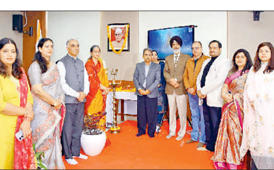
भिवानी। दीप प्रज्वलित करके कार्यक्रम का शुभारंभ करवाते हुए।