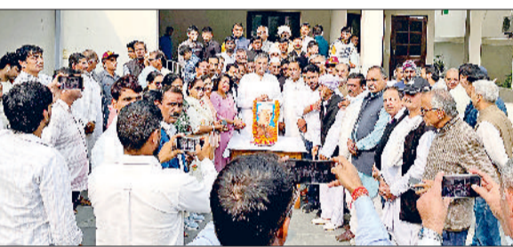
भिवानी। नेहरू जयंती पर आयोजित कार्यक्रम में पुष्प अर्पित करते हुए।