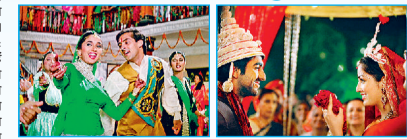
'हम आपके हैं कौन' में सलमान-माधुरी दीक्षित